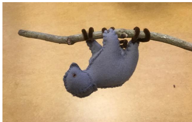
Luiard, gemaakt naar een zelf ontworpen patroon. Klas 6.