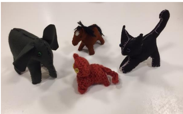
Gebreide poes uit klas 3 en vilt dieren uit klas 5.