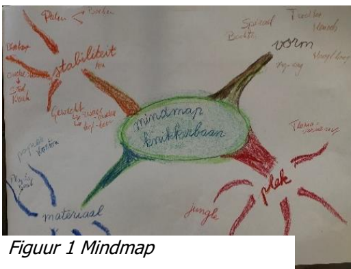
Figuur 1 Mindmap

Juf Irene en juf Funda begeleiden deze enthousiaste kinderen elke maandagmiddag!