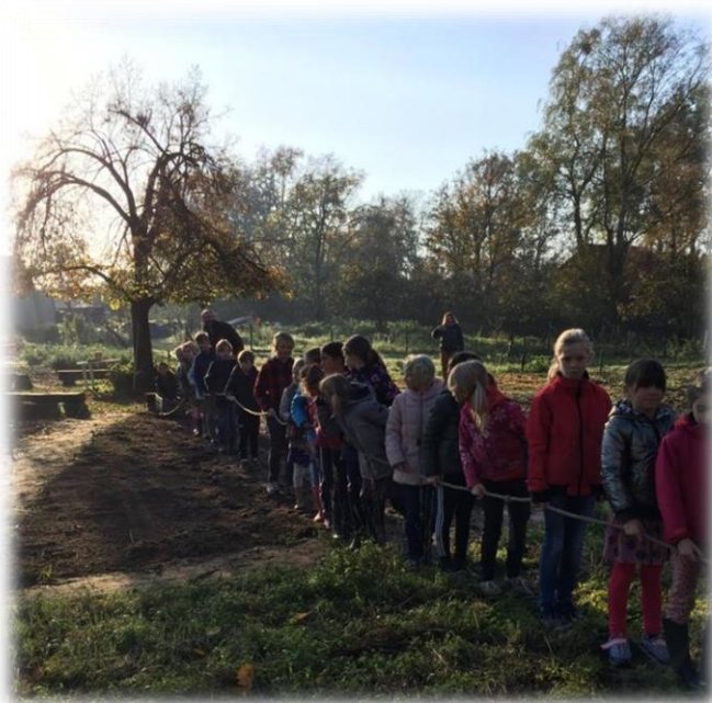
Winterrogge zaaien klas 3 Soscha/Hiltje

Email: e.schrijvers@vrijeschooldeberkel.nl