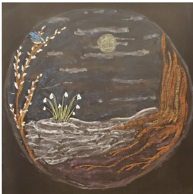
Bordtekening klas 2 Suzanne

Email: e.schrijvers@vrijeschoolzutphen.nl